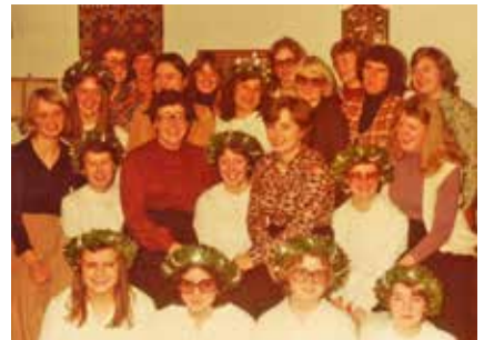
14 Lucior av 20 på Norrevång 1978