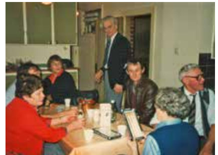
Tranesgårdens kök efter Lucia 1984