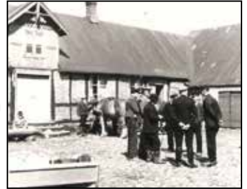
Gästgivaregården med statister filmsinspelning 1944