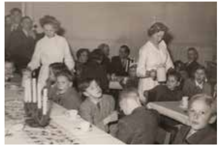
Luciakaffe Kommunalrummet 1951