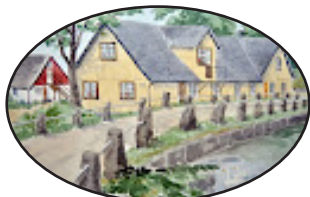
STF Munkamöllan Logi