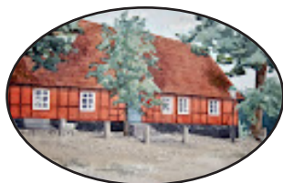
Festsalar & Konferens