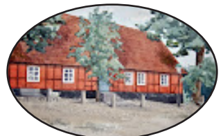
Festsalar & Konferens