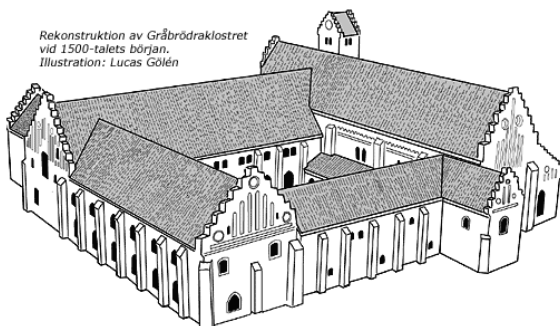
Rekonstruktion av Gråbrödrakloster vid 1500-talets början. Illustration: Lucas Gölén

Museum. Just nu pågår en utställning om just klostret och dess historia. Olika ordensdräkter visas, bland annat Premonstratensordens vita dräkt.