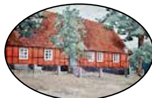
Festsalar & Konferens