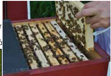
Ramarna i skattlådan