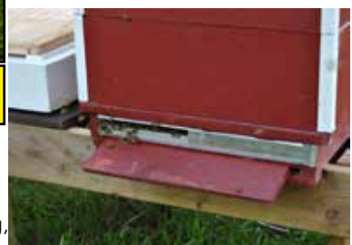
In- och utgång - fluster