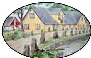
STF Munkamöllan Logi