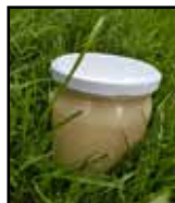
Honung en biprodukt