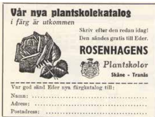
Annons i tidningen "Hem på Landet" 1958