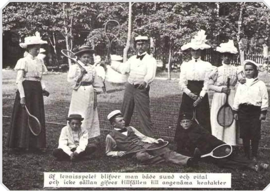
Af tennispelet bliver man både sund och vital och icke sällan gifves tillfällen till angenäma kontakter