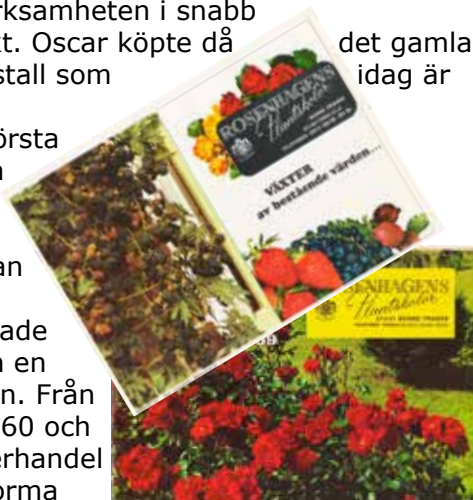
1969 kostade 5 st hallonbuskar 7 kr. Om man köpte 100 st fick man dem för 120 kr.

Oscar startade med odlingar av dahlior och liljor. Under kriget blev det ont om frukt och grönt och det var då han slog sig på att odla fruktträd. Detta var en synnerligen fruktbar idé och Österlen blev snabbt ett äppledistrikt. Som mest producerades ungefär 500 000 träd per år. Under 50-talet växte och utvecklades verksamheten i snabb takt. Oscar köpte då det gamla kostall som idag är