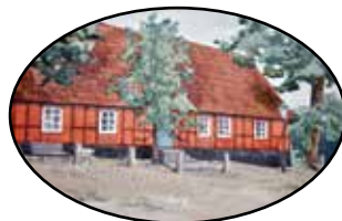
Festsalar & Konferens