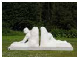
"Mannen genom krisen" Marsvinsholm