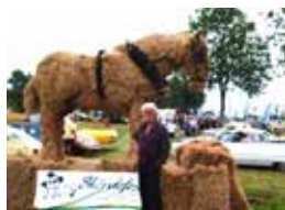
"Halmhästen" Munka Tågarp

Jón kommer ursprungligen från Island, men bor sedan ett antal år på gården Gimlelund i Lövestad. Här driver han och hustrun Pia hund- och katthotell, galleri och café i samklang med natur, hundar och islandshästar.