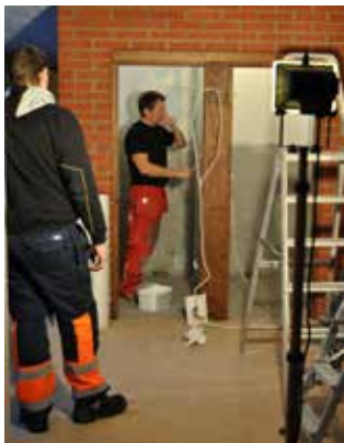
Glifberg d.y. iakttar

Tre välkända grabbar ägnar just nu kvällar och helger åt underhållande underhåll genom att renovera toaletterna och kapprummet. Nytt ljus innertak och en ny vägg ger kapprummet en välbehövlig ansiktslyftning.