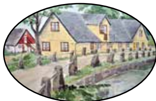
STF Hotell & Vandrarhem