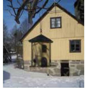
Skåne Tranås erbjuder mat och logi även för små fjäderklädda gäster.