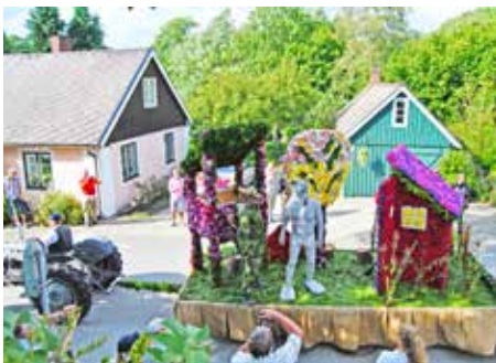
Hälge o co