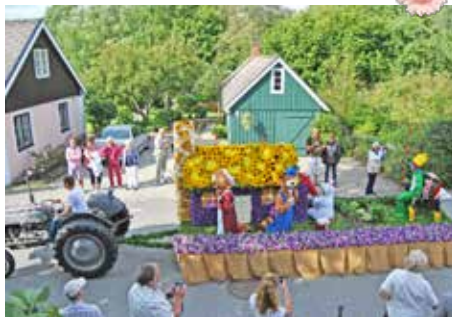
Bamse och hans vänner