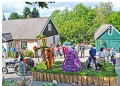
Tarzan och Fantomen