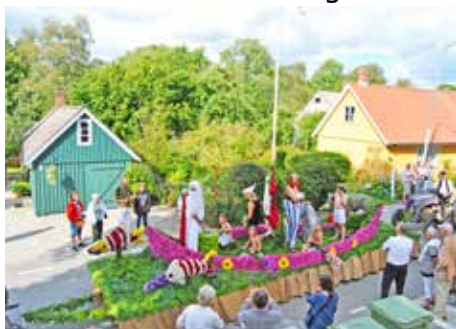
Asterix & Obelix