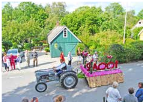
TUF 100 år