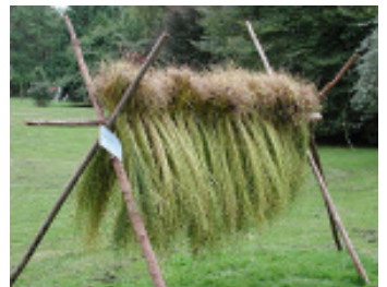
Linkärvar på tork