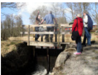
Dammluckan i Höör

Den 29 mars åkte ett glatt gäng på studieresa till Höör. Där finns nämligen den närmaste "Hälsans Stig". Vi träffade tjänstemän på kommunen som berättade om hur man tänkt och gjort samt hur man löst skötselfrågor och hur man använder sin stig för olika aktiviteter och evenemang. Vi provgick slingan, men blev inte allför imponerade. Däremot tog vi med oss många idéer och tankar kring vad man bör tänka på och hur det kan bli mycket bättre i Skåne Tranås.