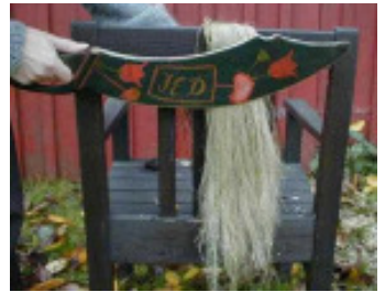
Linet skäktas med skäkteträ

Linberedningen skedde i följande ordning: