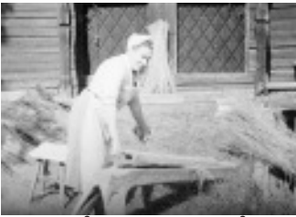
Linet bråkas med linbråga

När man skördat, torkat och rivit av fröna började själva beredningen av linet. Första momentet var rötningen, d.v.s. man lät linet ruttna ( på östskånska "ruddna" ). Efter rötningen forslade man linet till brydestugan.