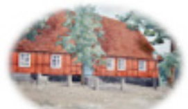
Festsalar & Konferens