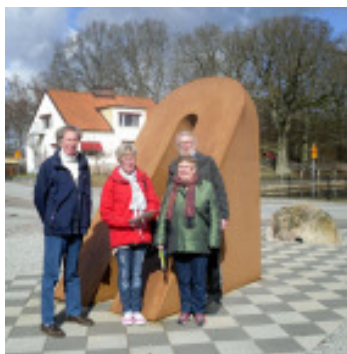
Gruppen vid Skånes Mitt

Den 29 mars åkte ett glatt gäng på studieresa till Höör. Där finns nämligen den närmaste "Hälsans Stig". Vi träffade tjänstemän på kommunen som berättade om hur man tänkt och gjort samt hur man löst skötselfrågor och hur man använder sin stig för olika aktiviteter och evenemang. Vi provgick slingan, men blev inte allför imponerade. Däremot tog vi med oss många idéer och tankar kring vad man bör tänka på och hur det kan bli mycket bättre i Skåne Tranås.