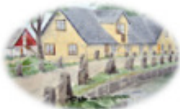
STF Hotell & Vandrarhem