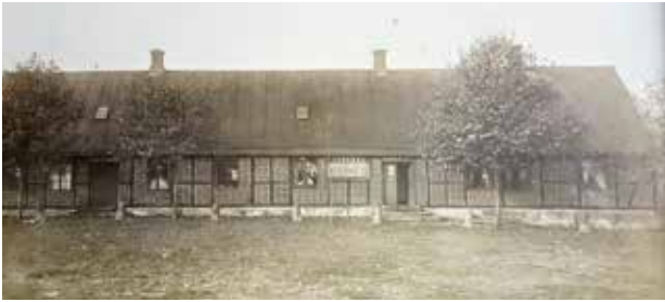
Tranås nr 26, nuvarande Tranesgården. Foto taget 1910

1836 fick Åbon Sven Johansson och hans hustru Pernilla tillåtelse av 13 ägare (Byamän) till det samfällda Torget att uppföra sig ett boningshus. Ingen av dem kom dock att flytta in i det nya huset. Pernilla avled 1837 av "håll och sting" och Sven avled 1840 av "färande sjukdom".