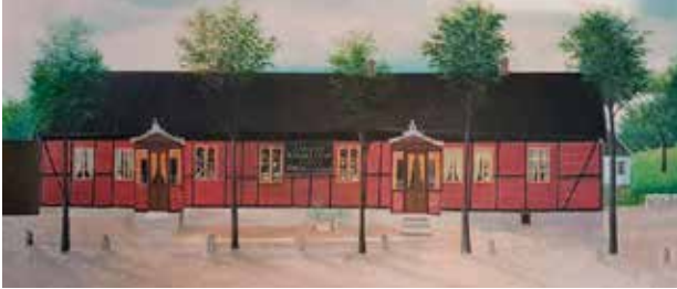
Pollarna i granit sattes 1871