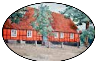
Festsalar & Konferens