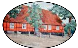
Festsalar & Konferens