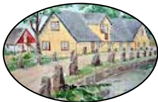
STF Munkamöllan Logi