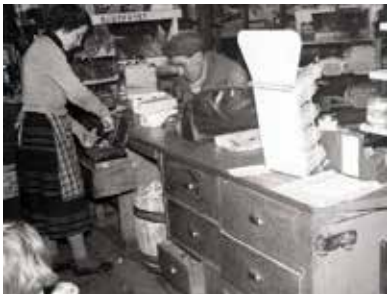
Lanthandeln vid Torget