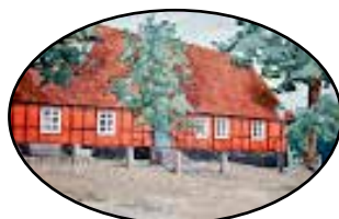
Festsalar & Konferens