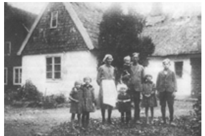
Klockaren med familj

Prästlönebostället är också lite speciellt. Kyrkans jordbruk var en av de största i