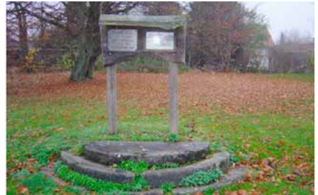
Den bevarade trappan Gästgivaregården

Gästgivaregården är spännande med sina "bokskyltar", den bevarade trappan, kullerstenen och sittplatserna. På bron vid Dammen sitter en skylt om Kvarndammen som bland annat även handlar om meteoren som föll ner där den 12 februari 1922. Kvarnen har ju en spännande historia och därför finns fyra skyltar nere vid Munkamöllan vid gallret där man kan se in på kvarnhjulet. Här kan man läsa om kvarnens tillkomst, om tiden som spinneri, om Tranås Ektricitetsverk och naturligtvis hur Kvarnen blev Munkamöllan Logi.