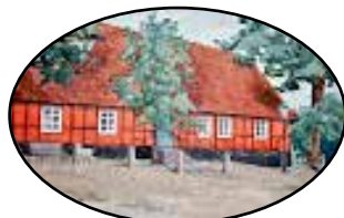
Festsalar & Konferens

Precis före Påsk fick Norrevång en överraskning från en "ganska ny bybo" vid namn Ingela. En tavla med hälsningen "En röd stuga och lite mjuka toner kanske kan bidra till Påskstämningen" Påsken blev ju inte som vanligt i år och gåvan var mycket uppskattad.