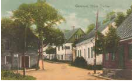
Korsvägen - vykort

Korsvägen , där de gamla diligensvägarna i öst-västlig och nord-sydlig riktning korsades är en historisk plats. Här fanns förr spettkaksbageri, blomsterhandel, manufakturaffär och biograf. På bion visades stumfilm med piano och dragspelsackompanjemang. Inträdet var 1:10 strax innan den lades ner 1929.