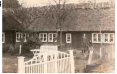
Den gamla smedjan

Smedjan , idag populärt hotellboende med "lantlig charm". Huset är en kopia av den gamla smedjan som låg här. Tomten har varit bebyggd sedan 1600-talet. TUF köpte det gamla huset 1989 och erhöll Tomelilla kommuns Kulturpris för den nya byggnaden.