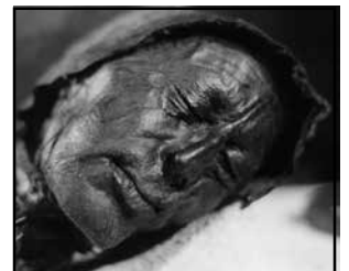
Tollundmannen 300 fKr.

Under järnåldern (från ca 500 fKr) användes torv för husbygge och sannolikt även som bränsle. Men järnet då? Myrmalm kom ju också från mossar. Rödjord, myrmalm (limonit) grävdes upp och torkades. Då fick man fram järnoxid som därefter bearbetades i blästerugnar, en stenugn som eldades med kol och som man blåste med bälgar för att få upp förbränning och temperatur. När slagg rensats bort fick man till slut en klump med järnsvamp. Detta värmdes, man slog bort kolrester och andra föroreningar och till slut hade man fått ämnesjärn som sen kunde smidas. Att framställa järn ur myrmalm är ett tungt arbete. Det går åt ca 200 kg rödjord till knappt 10 kg ämnesjärn. Blästerugnar användes fram till sen medeltid och ersattes så småningom av masugnar ur vilka man får smält järn.