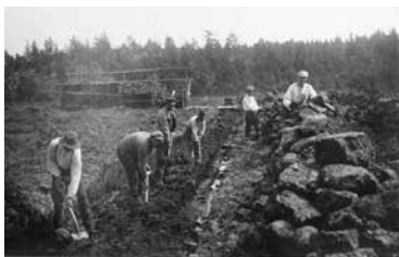
lånad bild från torvupptagning

Torv är sammanpressade växtdelar i mossar och kärr som p.g.a syrebrist endast delvis förmultnat.