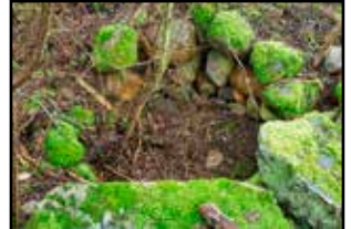
Rester av brunn?