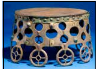
Balkåkratrumman hittades i en mosse och är från bronsåldern 1800-1500 fKr.

Redan under sen jägarstenålder finns arkeologiska bevis för att man "offrat" flintredskap och benverktyg i våtmarker, riter som fortsatte utföras genom historien. I danska mossar har omfattande offerfynd gjorts, fynd som utgörs av både föremål och människor. De danska mossliken ger oss en hisnande känsla av närhet till förhistorien, mossens kemiska sammansättning har bevarat dessa människor otroligt väl. Fynden ger oss en inblick i järnålderns rituella aktiviteter, ritualer där våtmarken utgjorde en mycket viktig plats. Kanske en plats där det levande mötte det döda, en dörr mellan förfädernas värld och vår värld.